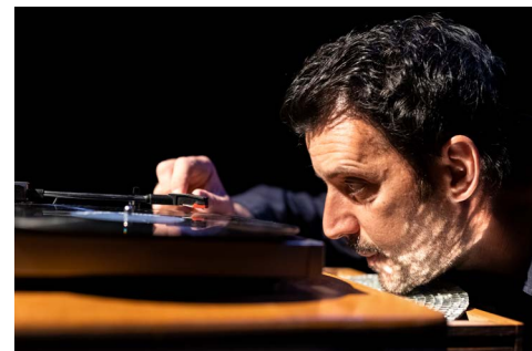
La Sieste au Bois Dormant - résidence à l'Espace René Proby Saint-Martin-d'Hères - avril 2021 - © Pascale Cholette

De septembre 2020 à septembre 2021, il produit également le podcast Dimanches .