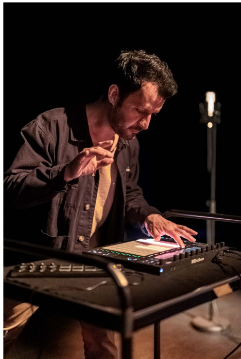
La Sieste au Bois Dormant - résidence à l'Espace René Proby Saint-Martin-d'Hères - avril 2021

La Sieste au Bois Dormant est un seul en scène dans lequel le conteur Rémi Ansel Salas revisite son enfance et sa découverte de la fiction, accompagné d'un dispositif de MAO, d'une platine vinyle et de sa collection de disques de contes pour enfants.