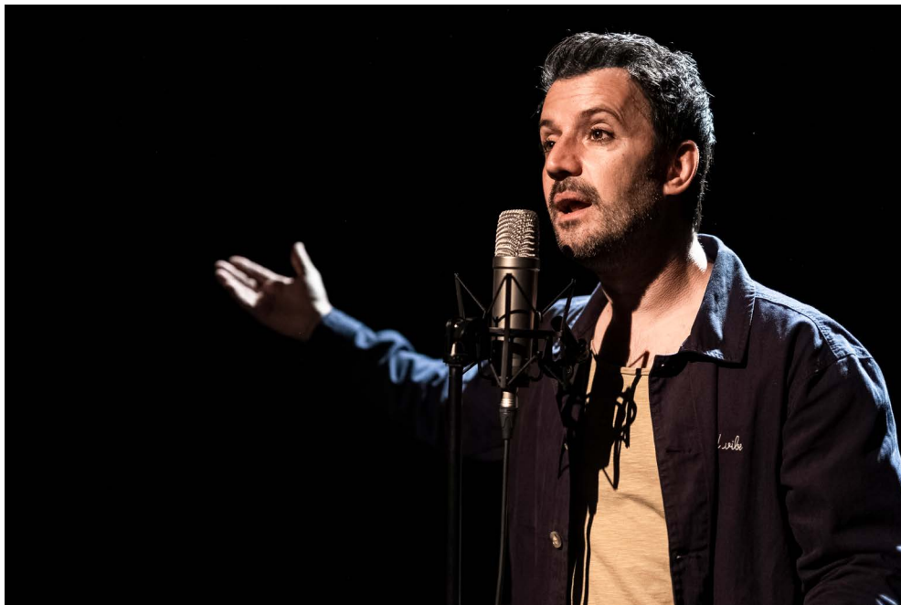
La Sieste au Bois Dormant - résidence à l'Espace René Proby - Saint-Martin-d'Hères - avril 2021 - © Pascale Cholette

Je veux proposer un spectacle avec une dimension poétique, porté par une parole belle comme un geste dansé, pour offrir au public un rendez-vous empreint de douceur et d'émerveillement.