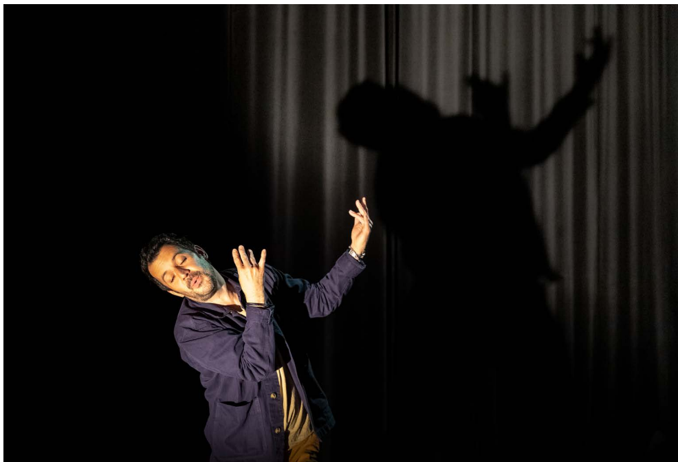
La Sieste au Bois Dormant - résidence à l'Espace René Proby - Saint-Martin-d'Hères - avril 2021

Depuis 2017, ce rapport aux récits est aussi investi par la réalisation de webdocumentaires, le plus souvent sonore.